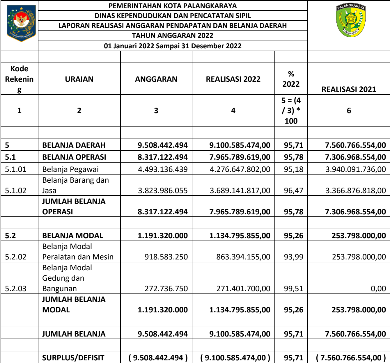
Tabel III.7 LAPORAN REALISASI ANGGARAN (LRA) T.A. 2022

Realisasi anggaran dalam masing-masing program/ kegiatan Dinas Kependudukan dan Pencatatan Sipil Kota Palangka Raya Tahun 2022 dijelaskan sebagai berikut: