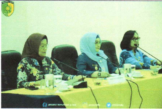
Wakil Wali Kota Palangka Raya didampingi Sekda Kota Palangka Raya menghadiri wawancara kandidat nominasi Paritrana Award tingkat Provinsi Kalimantan Tengah tahun 2022, bertempat di Ruang VIP Room M Bahalap Hotel Palangka Raya (09/02/2023)