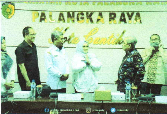
Wakil Wali Kota Palangka Raya menerima Audiensi Sekretaris Dirjen Pendidikan Anak Usia Dini, Pendidikan Dasar dan Pendidikan Menengah Kemendikbud Ristek RI bertempat di Ruang Rapat Peteng Karuhei 1 Kantor Wali Kota Palangka Raya (15/2/2023)