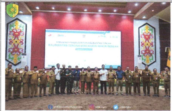
Sekda Kota P.Raya Menghadiri Forum Ketenagalistrikan Kalteng di Aula Jaya Tingang Kantor Gubernur Kalteng (06/06/2023)