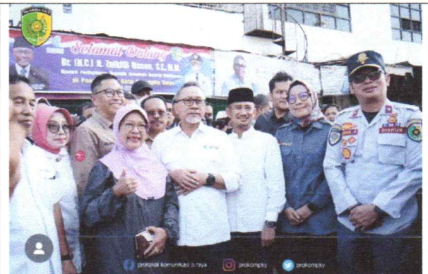
Walikota dan Sekda Kota P.Raya mendampingi Kunker Menteri Perdagangan RI di Pasar Besar Palangka Raya (03/06/2023)