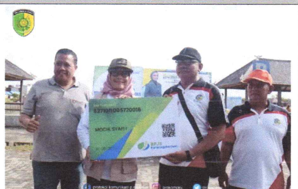
Sekda Kota P.Raya menghadiri sekaligus memberikan sambutan acara Senam Bersama sekaligus Penyerahan Secara Simbolis Kartu BPJS Ketenagakerajaan (09/06/2023)