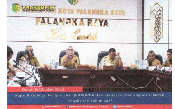
Senin, 16 Oktober 2023 Rapat Koordinasi Pengendalian (RAKORDAL) Pelaksanaan Pembangunan Daerah Triwulan III Tahun 2023