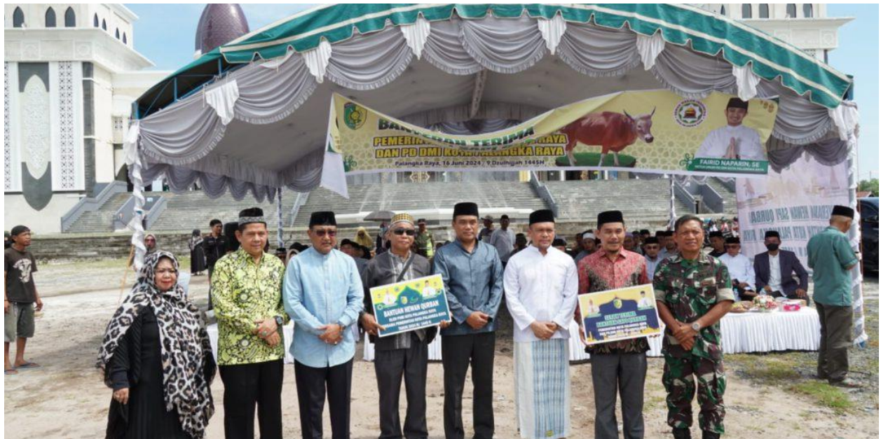
Pemko Palangka Raya Salurkan 35 ekor Hewan Kurban