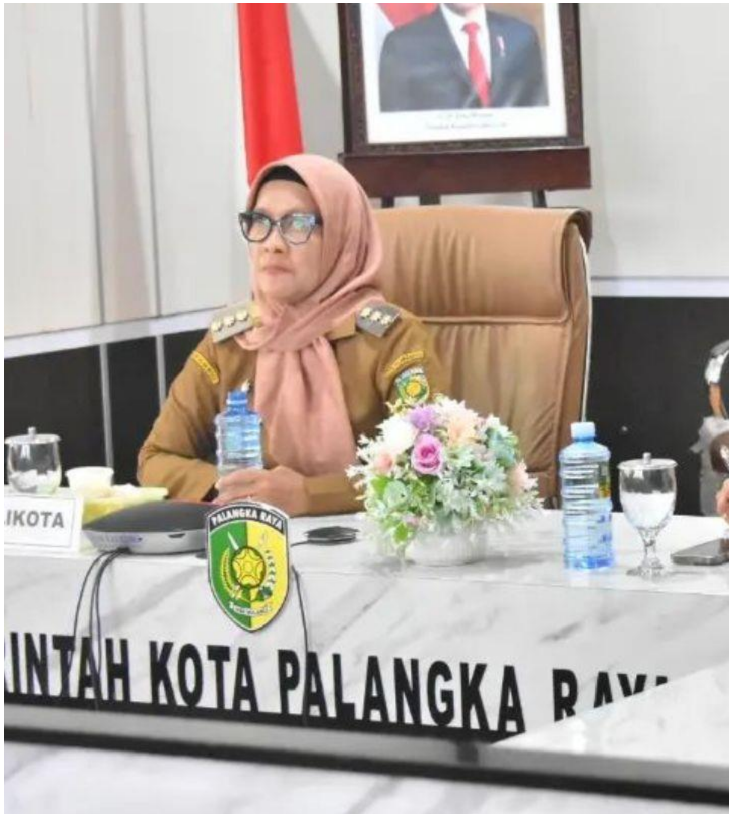
MEDIA CENTER, Palangka Raya – Penjabat (Pj) Wali Kota Palangka Raya, Hera Nugrahayu