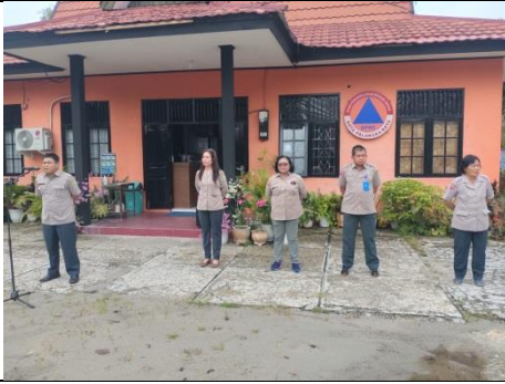
Apel Pagi di Halaman Kantor BPBD Kota Palangka Raya