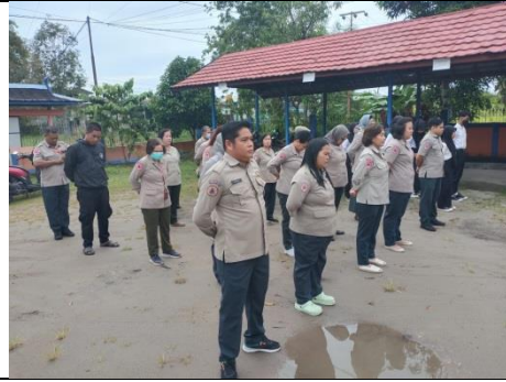
Bersiaga di Posko