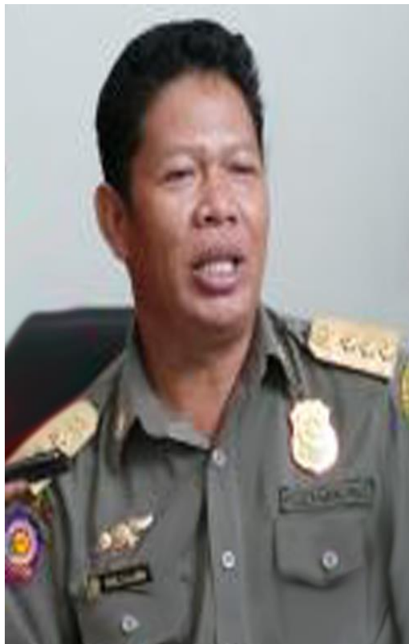
SUEL, S.Ag., M.Sc.