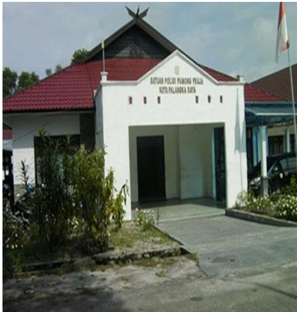
Kantor Satpol PP Kota Palangka Raya yang Lama Jl. Tjilik Riwut Km. 5,5 No. 98 Palangka Raya.