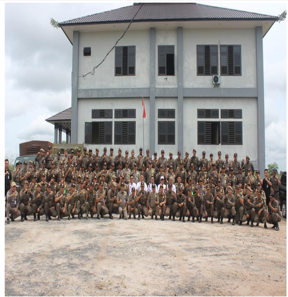
Kantor Satpol PP Kota Palangka Raya yang Baru Komplek Balai Kota Palangka Raya Kawasan Strategis Lingkar Dalam Blok B Nomor 20 Kode Pos